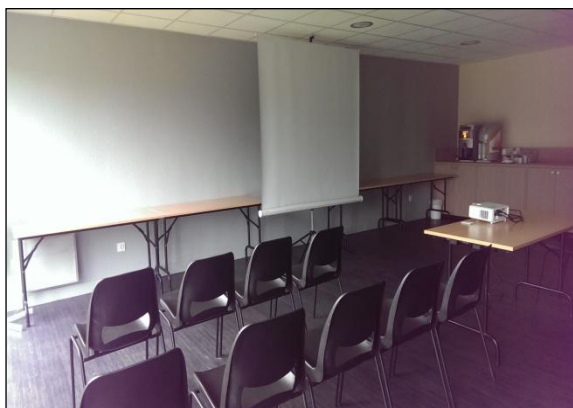
Salon BRAHMS, rénové Août 2014