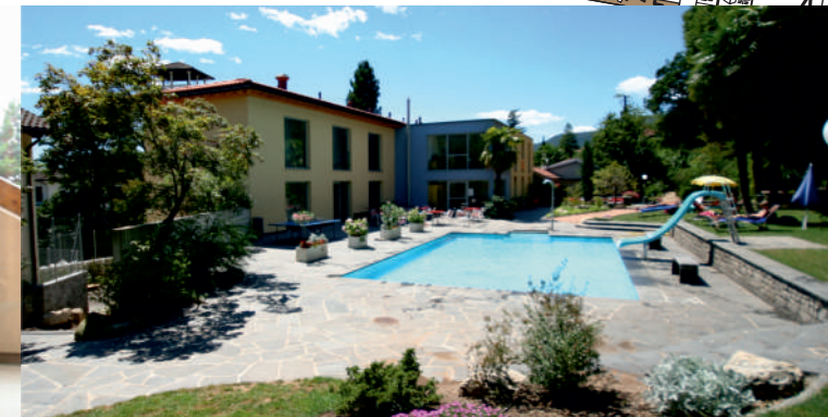
l'Auberge • the Hostel