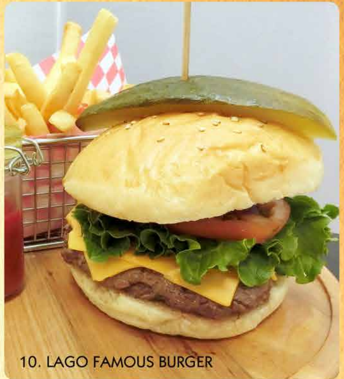
10. LAGO FAMOUS BURGER