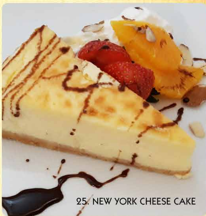
25. NEW YORK CHEESE CAKE