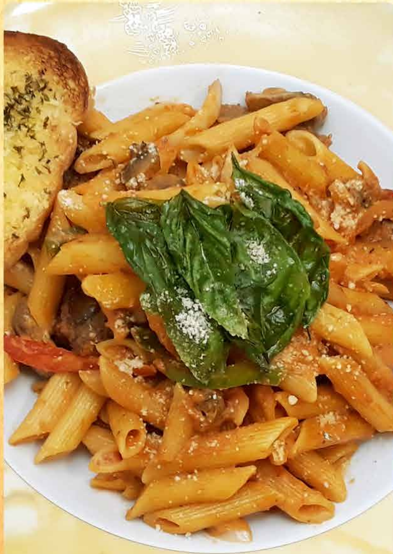
14. PENNE PASTA NAPOLETANA