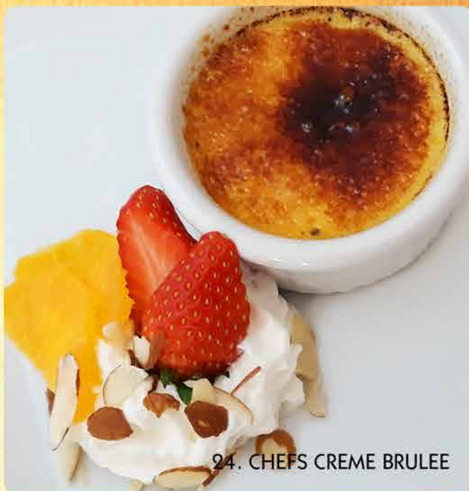
24. CHEFS CREME BRULEE