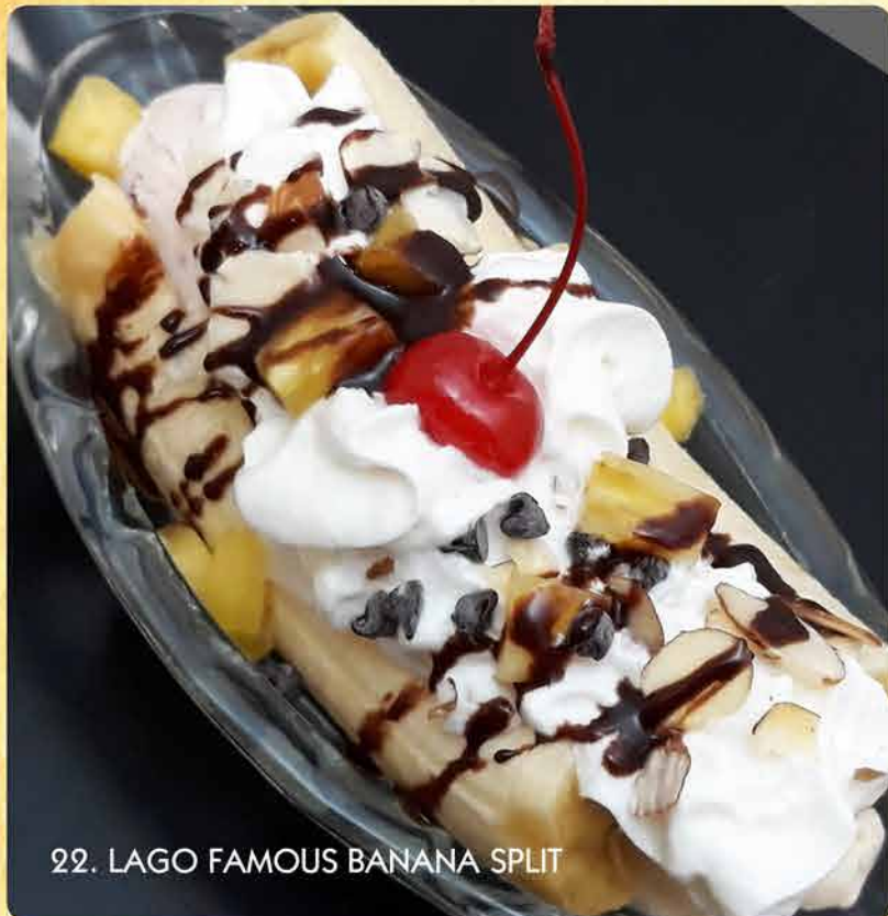
22. LAGO FAMOUS BANANA SPLIT