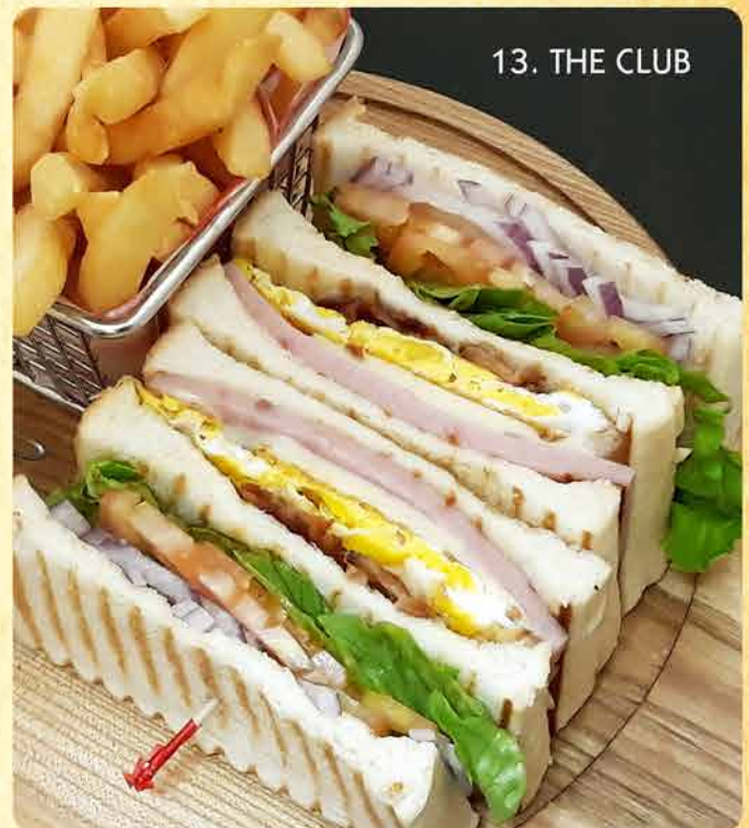
13. THE CLUB