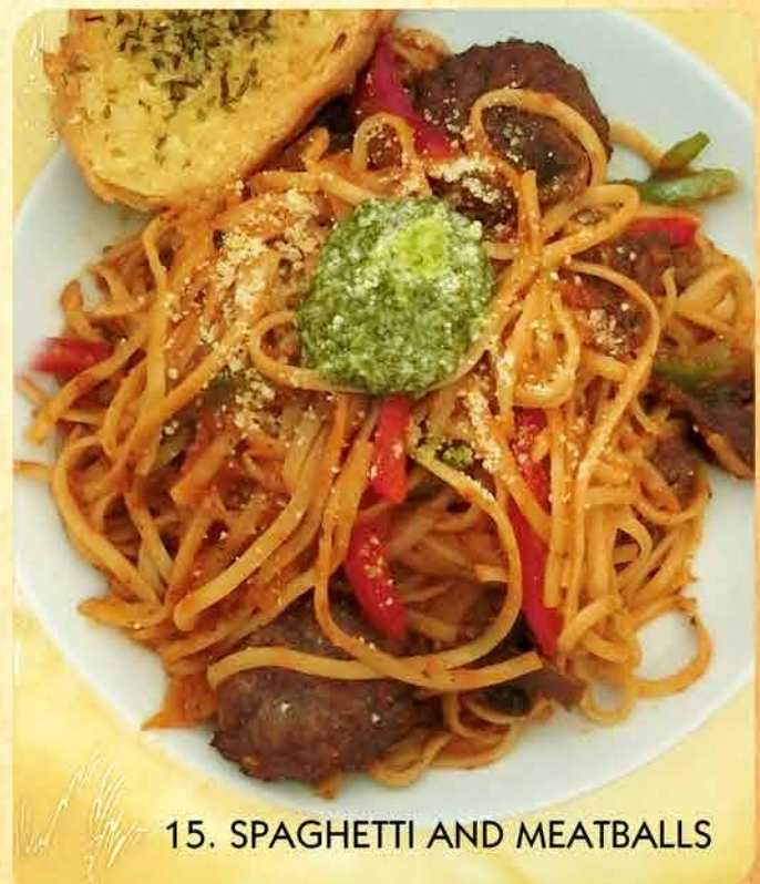
15. SPAGHETTI AND MEATBALLS