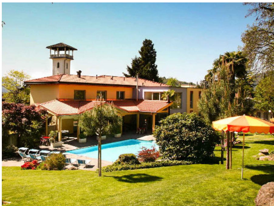
Jugendherberge Lugano – Savosa