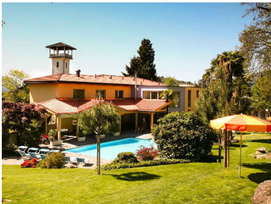
Ostello della gioventù Lugano – Savosa