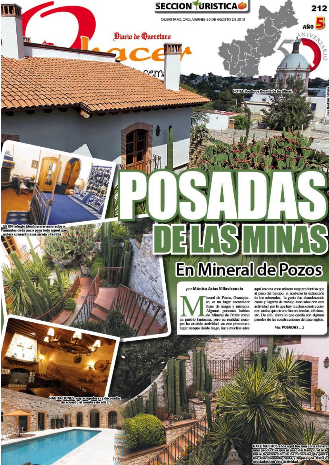
HOTEL Boutique Posada de las Minas.