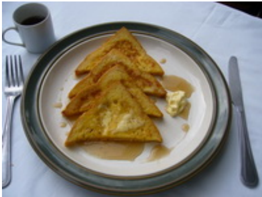
No.11 French Toast