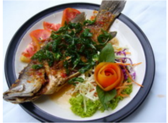
No.79 Deep Fried Plakapong in Spicy Sweet & Sour Sauce ปลากระพงทอดราดพริก ฿ 450