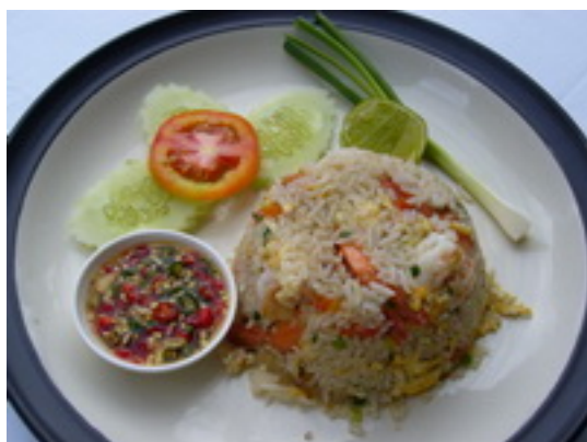
No.133 Fried Rice With Prawns, Crab Or Seafood Topped With Fried Egg ข้าวผัดหมูหรือไก่ ฿ 140 เพิ่มไข่ดาว ฿ 160 (ข้าวผัดกุ้ง,ปู หรือทะเล ฿ 150 เพิ่มไข่ดาว ฿ 170)