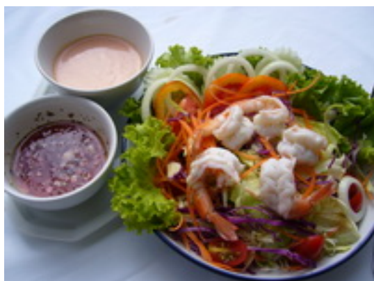
Shrimp or Crab Salad สลัดกุ้ง หรือ ปู ฿ 200