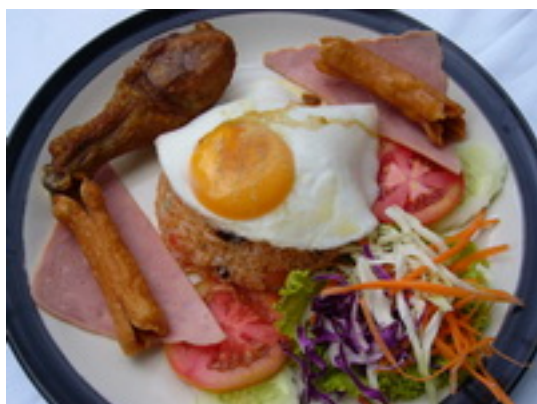
No.131 American Fried ข้าวผัดอเมริกัน ฿ 200