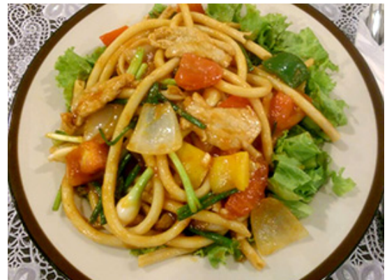
No.67 Fried Macaroni With Chicken or Pork ผัดมกกะโรนีไก่ หรือหมู ฿ 160