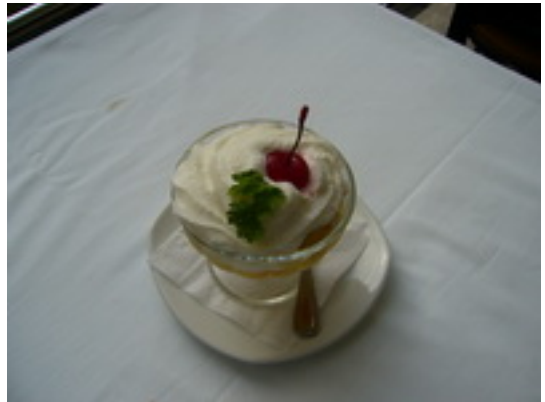
Fruit Cocktail ค็อกเทลผลไม้ ฿ 100