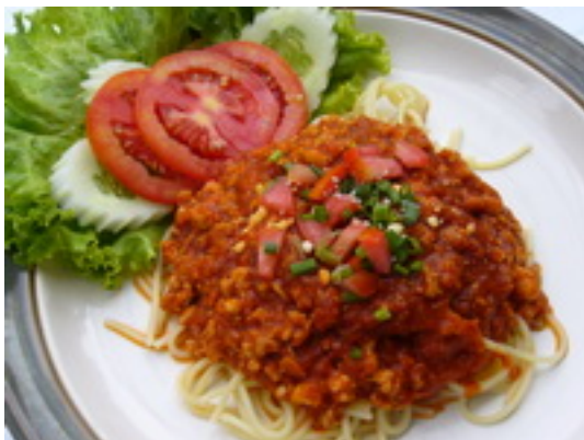
No.66 Spaghetti Pork or Tomato Sauce สปาเก็ตตี้หมู,ไก่หรือ ซอสมะเขือเทศ ฿ 160 ( กุ้งหรือทะเล ฿ 190)