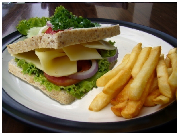
Whole Wheat Cheese Sandwich ₱ 130