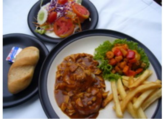
No.54 Grilled Fillet Mignon (Pork) หมูสันในพันเบคอนราดซอสเห็ด ฿ 320