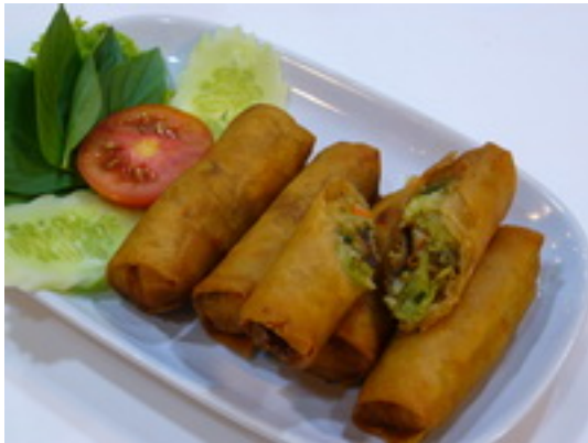
Spring Rolls ปอเปี๊ยะทอด ฿ 120