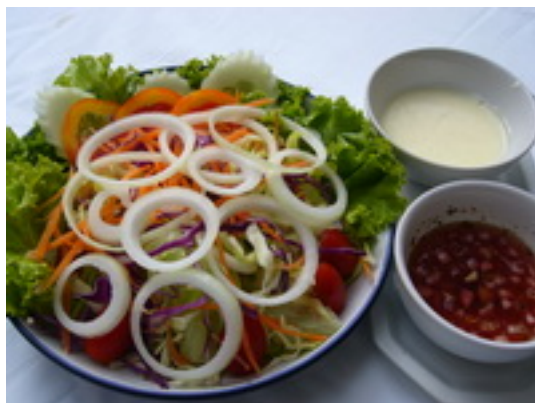
No.34 Vegetable Salad สลัดผัก ฿ 120