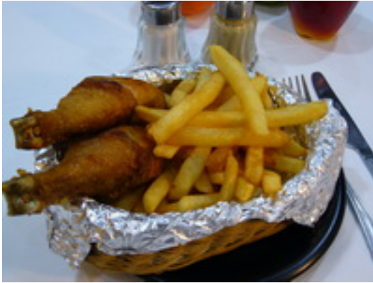
Chicken In The Basket ไก่ตะถักร้า ฿ 180