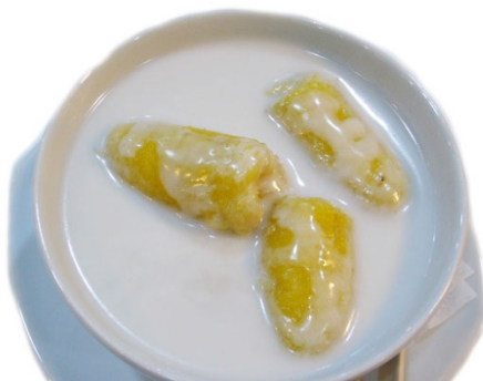
Creamy Banana กล้วยบวขี้ ฿ 55