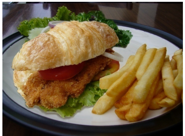
Chicken Croissant Sandwich ₱150