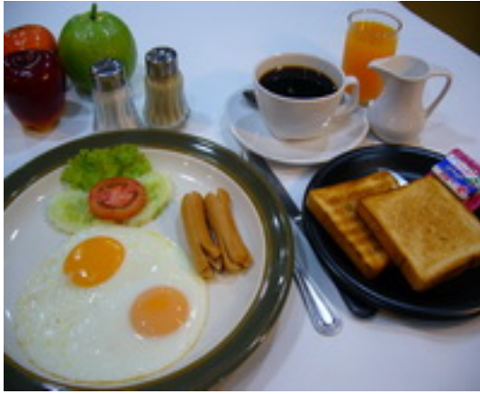
American Breakfast Set ชุดอาหารเช้าแบบอเมริกัน ฿ 180