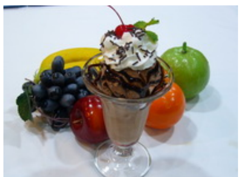
Chocolate Sundae ช็อกโกแลตชันเดย์ ฿ 65