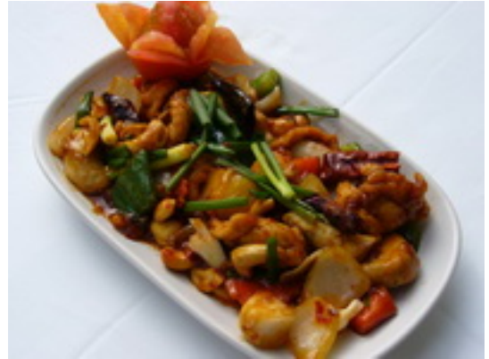
No.83 Fried Prawns or Chicken with Cashew Nut กุ้งหรือไก่ผัดเม็ดมะม่วงหิมพาน ฿200