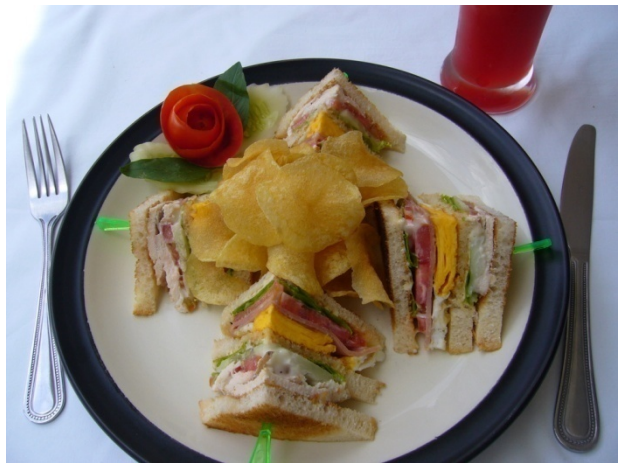
No.49 Club Sandwich ₱ 130