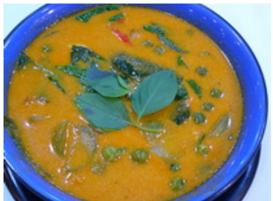
No.75 Pork or Chicken Curry With Coconut Milk แกงเผ็ดหมูหรือไก่ ฿ 180