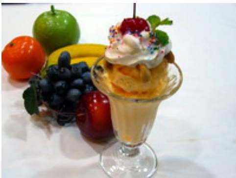
Vanilla Sundae วานิลลา ชันเดย์ ฿ 65