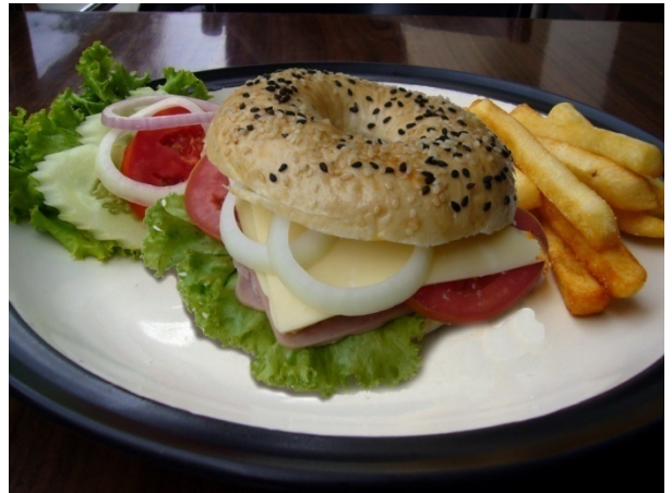
Bagel With Ham Cheese Sandwich ₱ 130