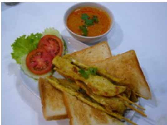
No.99 Pork Satay หมูสะเต๊ะ ฿ 180