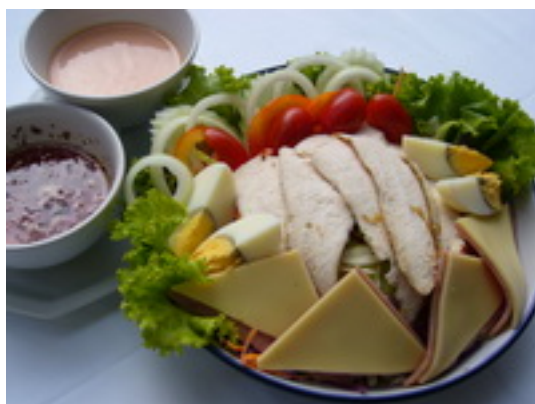
Mixed Salad Business Inn สลัดรวม บิสสิเนสส์ อินน์ ฿ 200