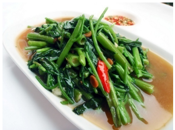
Fried Morning Glory ผัดผักบุ้ง ฿ 110