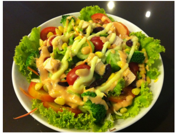
Healthy Salads สลัดเพื่อสุขภาพ ฿ 180