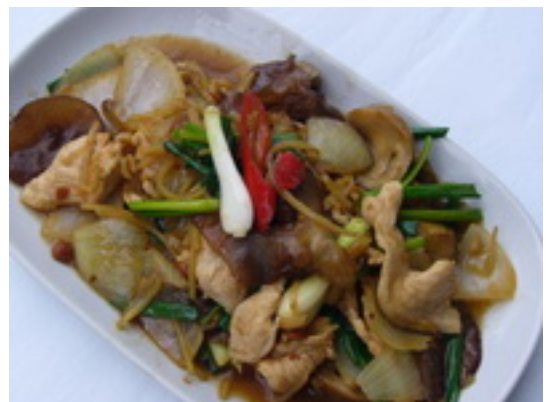
No.86 Fried Pork or Chicken With Ginger หมู หรือไก่ผัดขิง ฿ 170