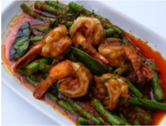
No.78 Fried Shrimps With Long Beans And Chilli Paste กุ้งผัดพริกแกงใส่ถั้วฝักยาว ฿ 200