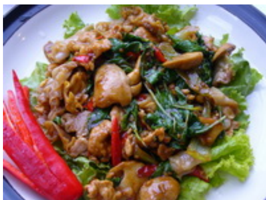
No.123 Fried Dry Noodle With Pork Or Chicken With Basil Leaves (Spicy) (Shrimp or Seafood ฿ 150) ก๋วยเตี๋ยวผัดซีเมาะหมู หรือไก่ ฿ 120 (กุ้งหรือทะเล ฿ 150)