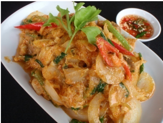
Fried Meat Crab with Curry Powder เนื้อปูผัดผงกะหรี่ ฿ 450