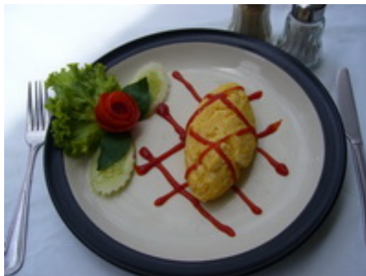
No.10 Omelets Of Your Choice (Ham, Bacon, Cheese) ไข่เจียวตามสั่ง (แฮม, เบคอน, ชีส) ฿ 75