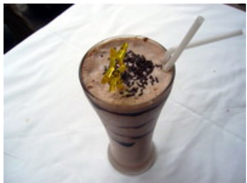
Chocolate Milk Shake ช็อกโกแลต มิลค์เชค ฿ 75