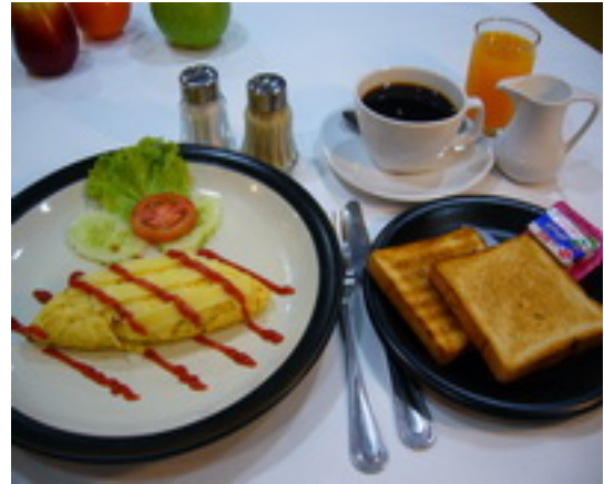
American Breakfast Set 3 ชุดอาหารเช้าแบบอเมริกัน ฿ 180