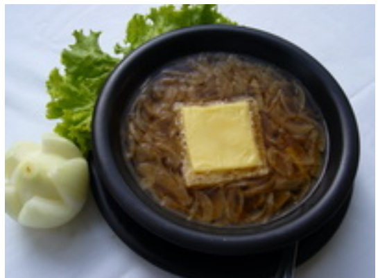
French Onion Soup ซูปหัวหอม ฿ 120