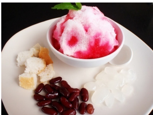
Thai Shaved Ice Dessert น้ำแข็งไส ฿ 55