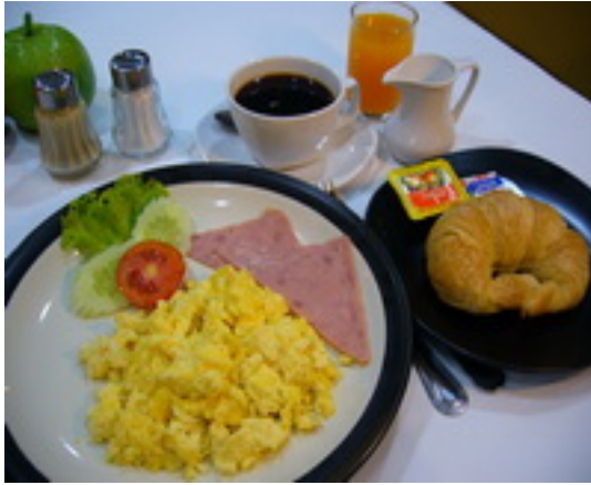
American Breakfast Set 1 ชุดอาหารเช้าแบบอเมริกัน ฿ 180