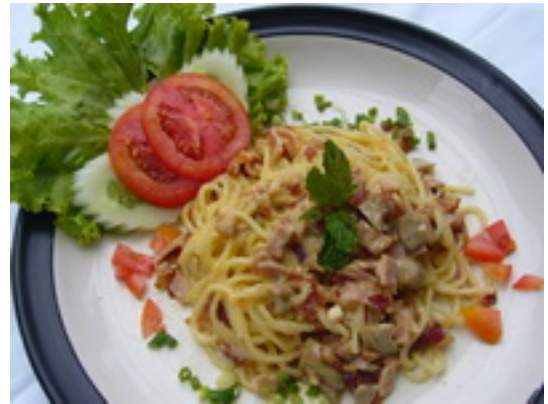
No.65 Spaghetti Carbonara สปาเก็ตตี้ซอสครีม,เห็ด,แฮม และเบคอน ฿ 150