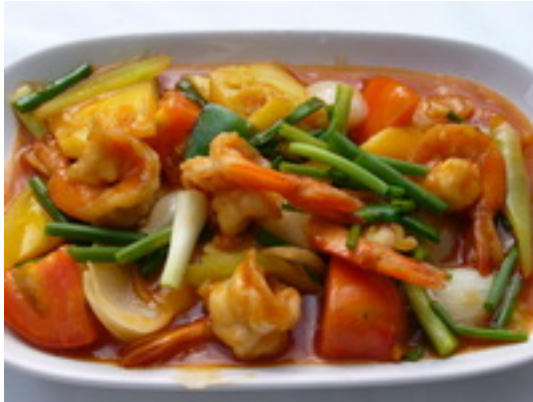
No.82 Sweet & Sour Pork , Chicken , Shrimp ผัดเปรี้ยวหวานหมู,ไก่,กุ้ง ฿200