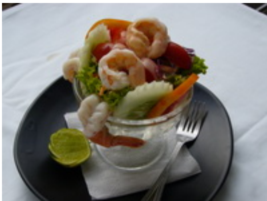
Shrimp Cocktail ค็อกเทลกุ้ง ฿ 150