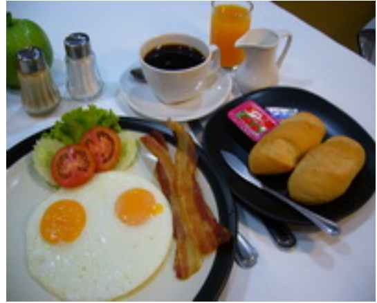
American Breakfast Set 2 ชุดอาหารเช้าแบบอเมริกัน ฿ 180