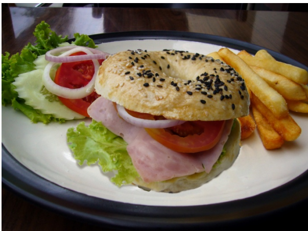
Bagel With Ham Sandwich ₱ 130