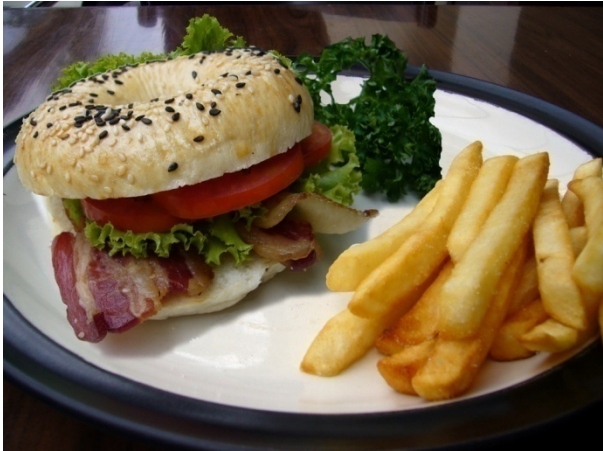
Bagel With Bacon Sandwich ₱ 130