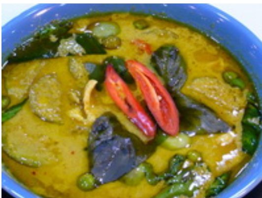
No.74 Pork or Chicken Green Curry With Coconut Milk (Prawns or Seafood ฿ 230) แกงเขียวหวานหมูหรือไก่ ฿ 180 (กุ้งหรือทะเล ฿ 230)