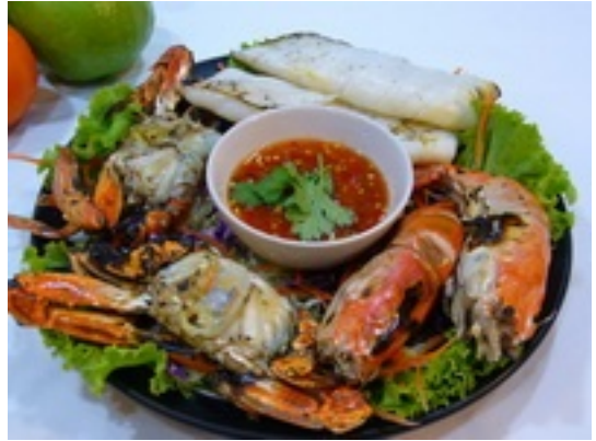
No.42 Mixed Grilled Seafood รวมมิตรทะเลย่าง ฿ 450