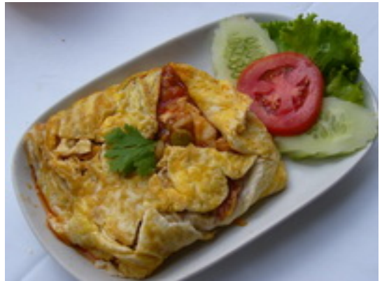
No.97 Stuffed Omelets With Pork or Chicken ไข่ยัดไส้หมู หรือไก่ ฿ 180