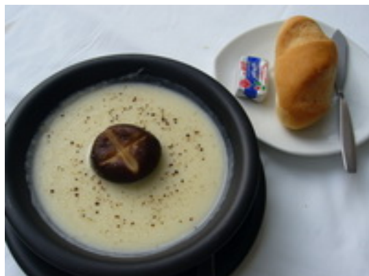
No.32 Cream Of Mushroom ซูปเห็ดหอม ฿ 120