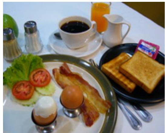
American Breakfast Set 5 ชุดอาหารเช้าแบบอเมริกัน ฿ 180