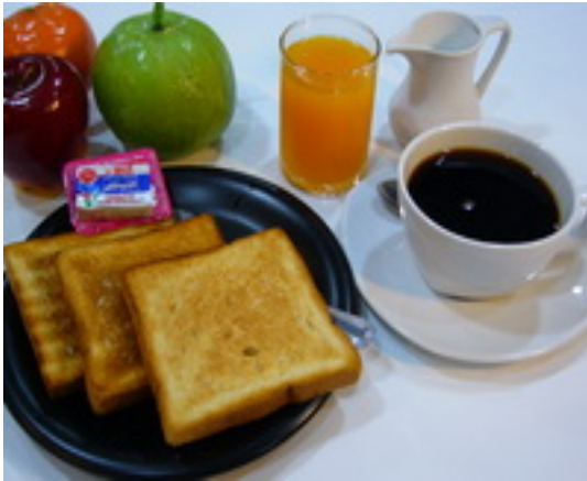
Continental Breakfast Set ชุดอาหารเช้าแบบคอนติเนนตัล ฿ 130