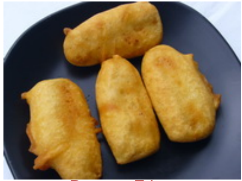
Banana Fritter กล้วยทอด ฿ 90