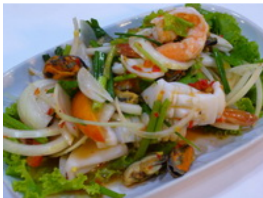
No.114 Spicy Seafood Salad ยำรวมมิตรทะเล ฿ 230