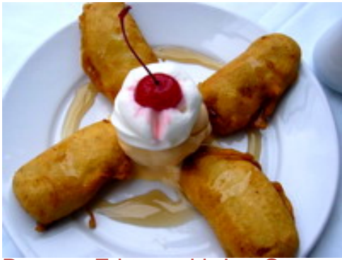
Banana Fritter with Ice Cream กล้วยทอดไอศครีม ฿ 150