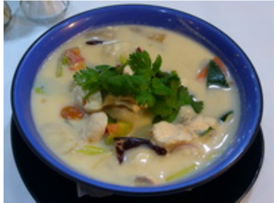
No.71 Thai Spicy Chicken Soup With Coconut Milk (Shrimp ฿ 230) ต้มข่าไก่ ฿ 180 (กุ้ง ฿ 230)