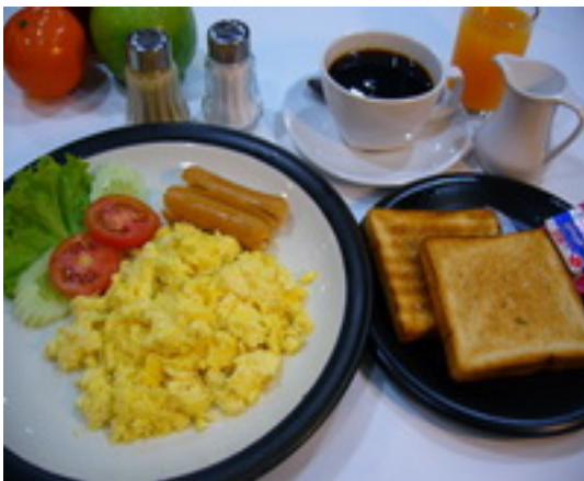
American Breakfast Set 4 ชุดอาหารเช้าแบบอเมริกัน ฿ 180