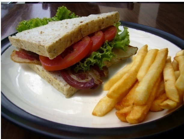
Whole Wheat BLT Sandwich ₱ 130