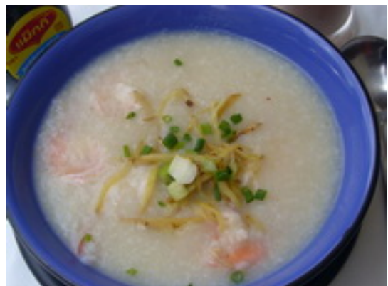
No.14 Rice Porridge With Shrimp or Fish (Chinese Style)