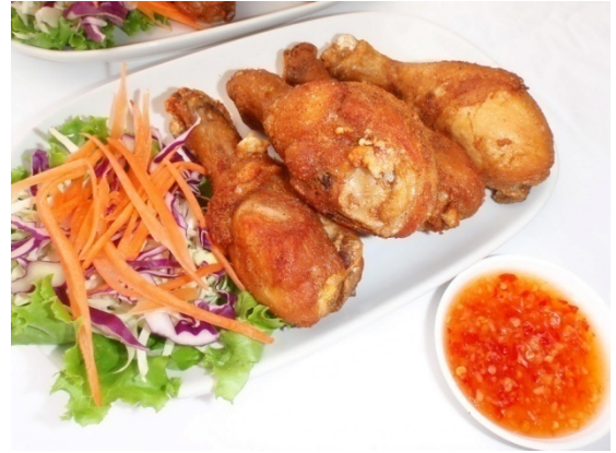
Fried Chicken Legs น่องไก่ทอด ฿ 180