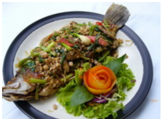
No.100 Deep Fried Fish With Chilli Ginger ปลาเจี๋ยน ฿ 450