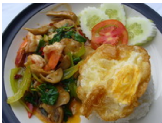
No.136 Fried prawns or squid or Seafood with basil leaves on rice ผัดกระเพรากุ้ง,ปลาหมึก หรือทะเล ฿ 170