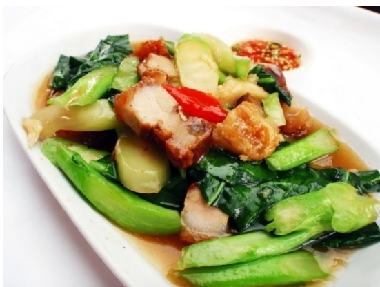
Fried Kale with Crunchy Pork คะน้าหมูกรอบ ฿ 220