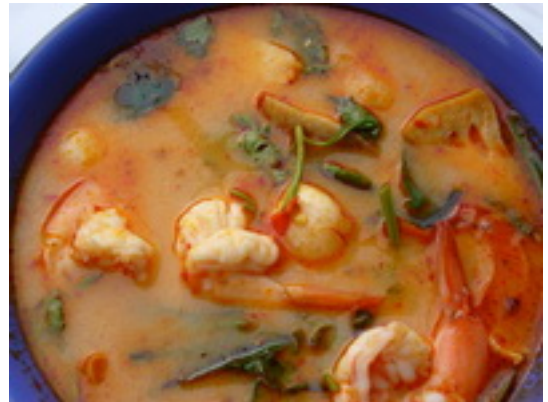
Tom-Yam-Kung ต้มยำกุ้ง ฿ 230 (ทะเล ฿ 250)