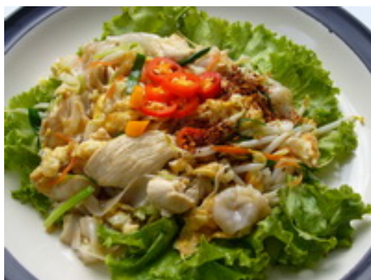
No.125 Fried Dry Noodles With Chicken or Pork ก๋วยเตี๋ยวผัดไก่ หรือหมู ฿ 120