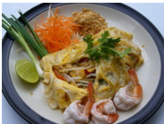
No.121 Phad Thai With Pork or Chicken (Shrimp or Seafood ฿ 150) ก๋วยเตี๋ยวผัดไทหมู, หรือไก่ ฿ 120 (กุ้งหรือทะเล ฿ 150)