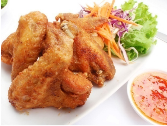
Fried Chicken Wings ปีกไก่ทอด ฿ 180