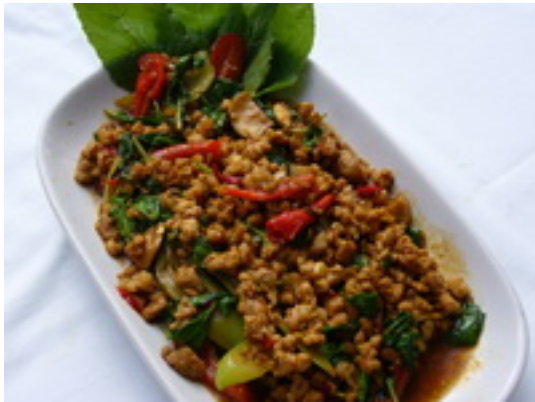
No.91 Fried Pork or Chicken With Basil Leaves หมู หรือไก่ผัดใบกระเพรา ฿ 170