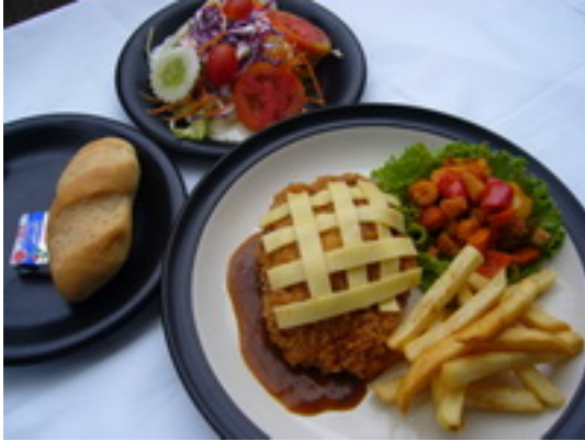
No.53 Pork or Chicken Cordonbleu หมูหรือไก่ยัดไส้แฮม และชีส ซูปแป้งขนมปังป่นทอด ฿ 320