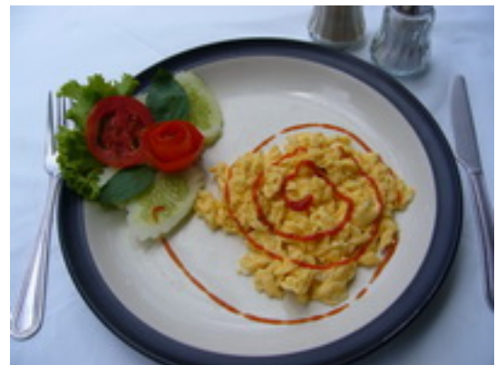
No.10_1 Scramble Egg Of Your Choice (Ham, Bacon, Cheese) ไข่เจียวตามสั่ง (แฮม, เบคอน, ชีส) ฿ 75