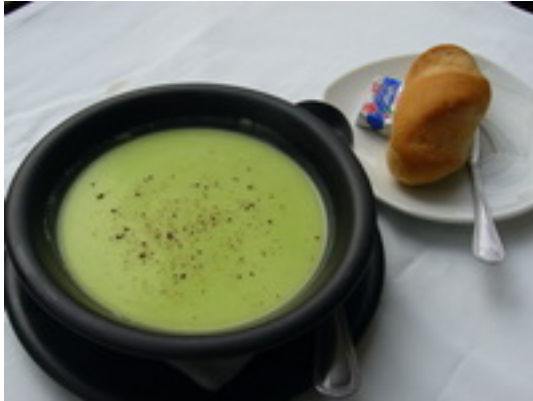
Cream Of Spinach soup ซูปผักโขม ฿ 120