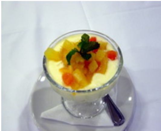
Fruit Yoghurt โยเกิร์ตผลไม้ ฿ 65