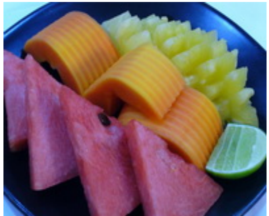
Season Fruits ( Small ) ผลไม้ตามฤดูกาล ฿ 65