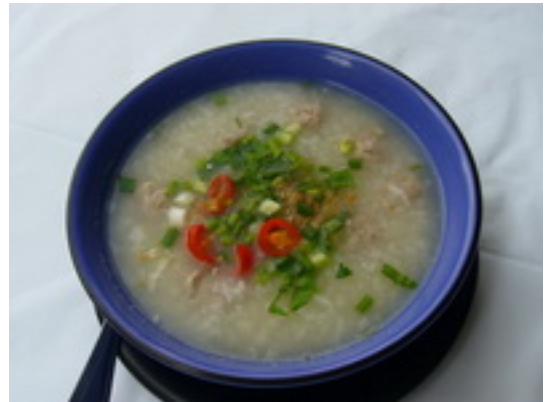
No.13 Boiled Rice with Chicken or Pork ฿ 100 ( Shrimp or Fish ฿ 150 )

ข้าวต้มไก่หรือหมู ฿ 100 (กุ้งหรือปลา ฿ 150)