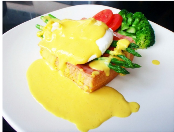
Eggs Benedict ไช้เบเนดิก ฿ 150