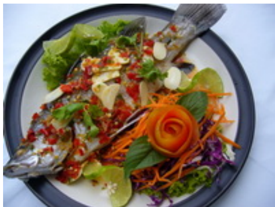
No.101 Steamed Fish With Lemon ปลานึ่งมะนาว ฿ 450