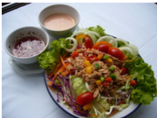
Tuna Salad ทูน่าสลัด ฿ 180