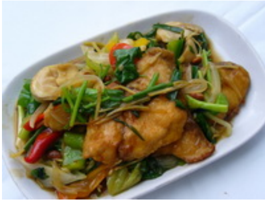
No.87 Fried Fish With Chinese Vegetables ปลากระพงผัดคีนี่ไข่ ฿ 250