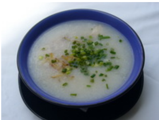
No.14 Rice Porridge With Pork Or Chicken

ข้าวต้มไก่หรือหมู ฿ 100 (กุ้งหรือปลา ฿ 150)