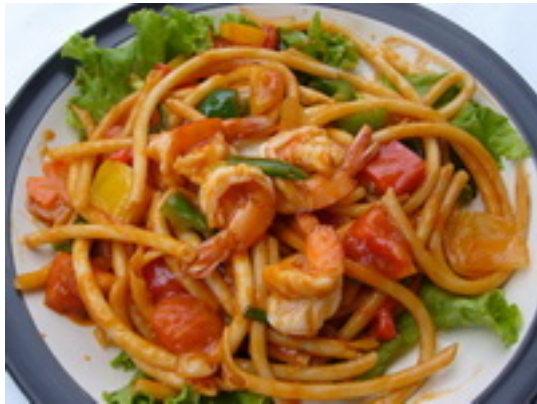
No.67 Fried Macaroni With Shrimps or Seafood ผัดมกกะโรนี กุ้ง หรือทะเล ฿ 190