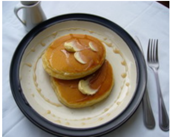
Pancake with Maple Syrup แพนเค้กพร้อมไซรัป ฿ 75