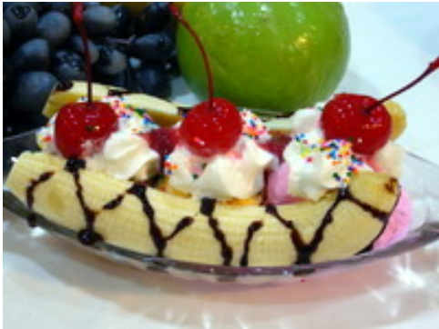
Banana Sprite บานาน่า สปิต ฿ 120