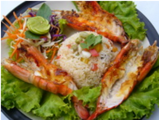
No.63 Grilled River Prawns & Buttered Rice กุ้งแม่น้ำราดซอสเนยกระเทียม เสิร์ฟกับข้าวอบเนย ฿ 360