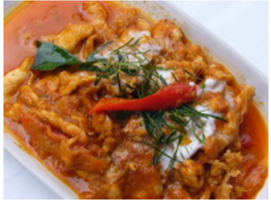
No.89 Fried pork or chicken dry curry ผัดพะแนงหมูหรือไก่ ฿ 180