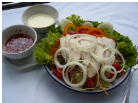
Chicken Salad สลัดไก่ ฿ 160