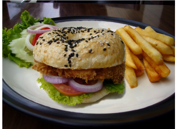
Bagel With Chicken Sandwich ₱ 150