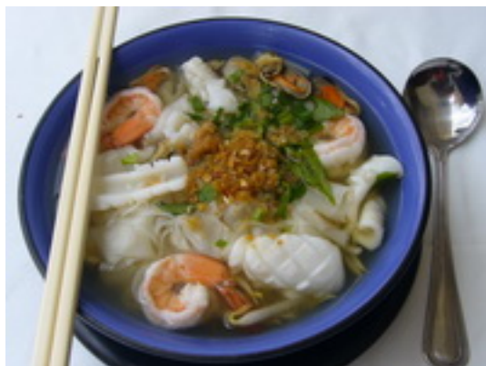
No.129 Noodles Soup With Pork,Chicken,Prawns or Seafood ก๋วยเตี๋ยวน้ำหมูหรือไก่ ฿ 120(กุ้งหรือทะเล ฿ 150)