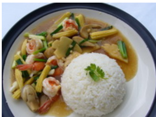
No.132 Steamed Rice Topped With Sauted Pork or Chicken (Shrimp or Seafood ฿ 150) ข้าวราดหน้าหมู หรือไก่ ฿ 120 ( กุ้งหรือทะเล ฿ 150)