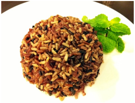
Brown Rice ข้าวกล้อง ฿ 35