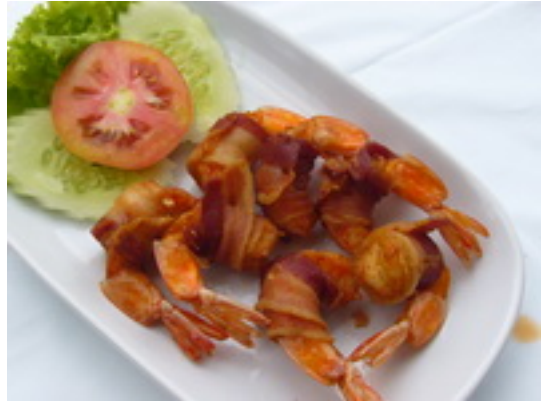
No.20 Fried Shrimp Wrapped In Bacon กุ้งพันเบคอน ฿ 230