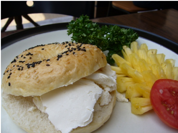
Bagel With Cream Cheese Sandwich ₱ 120