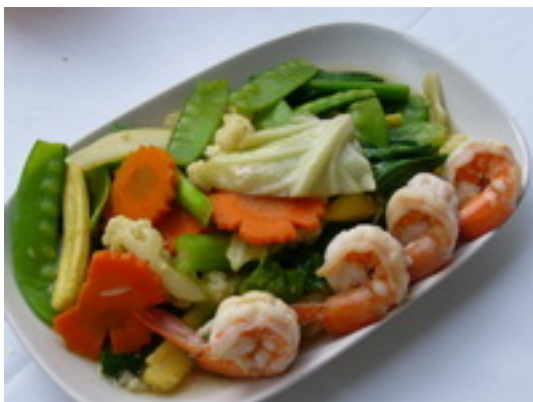
No.85 Fried Mixed Vegetables With Pork , Chicken or Prawns ผัดผักรวมมิตรหมู,ไก่ หรือกุ้ง ฿ 200