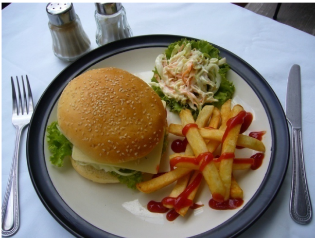
Cheese Burger ₱ 150