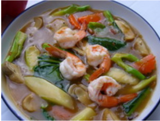
No. Noodles Topped With Seafood ก๋วยเตี๋ยวราดหน้าทะเล ฿ 150