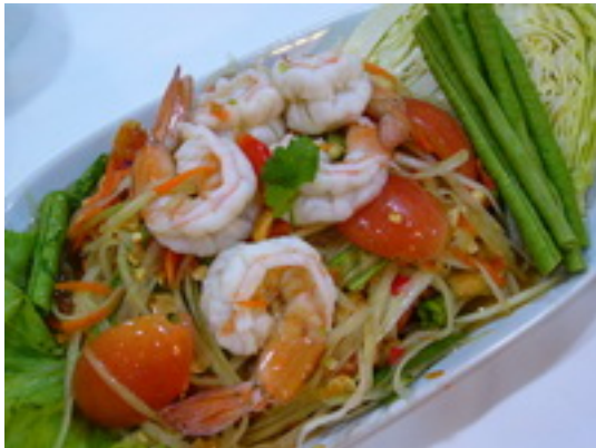
Spicy Thai Salad (Som_Tum) ส้มตำไทยกุ้งสด ฿ 150