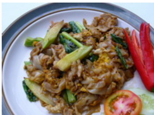
No.119 Fried Dry Noodle In Soya Sauce With Pork or Chicken (Shrimp or Seafood ฿ 150) ก๋วยเตี๋ยวผัดซีอิ้วหมู หรือไก่ ฿ 120 (กุ้งหรือทะเล ฿ 150)