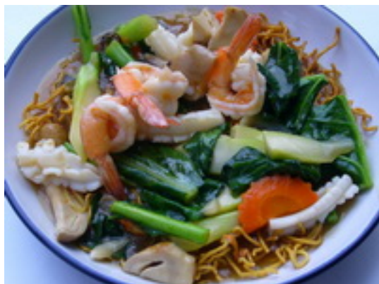
No.128 Fried Egg Noodles Topped With Prawns or Seafood บะหมี่กรอบราดหน้ากุ้ง หรือทะเล ฿ 150