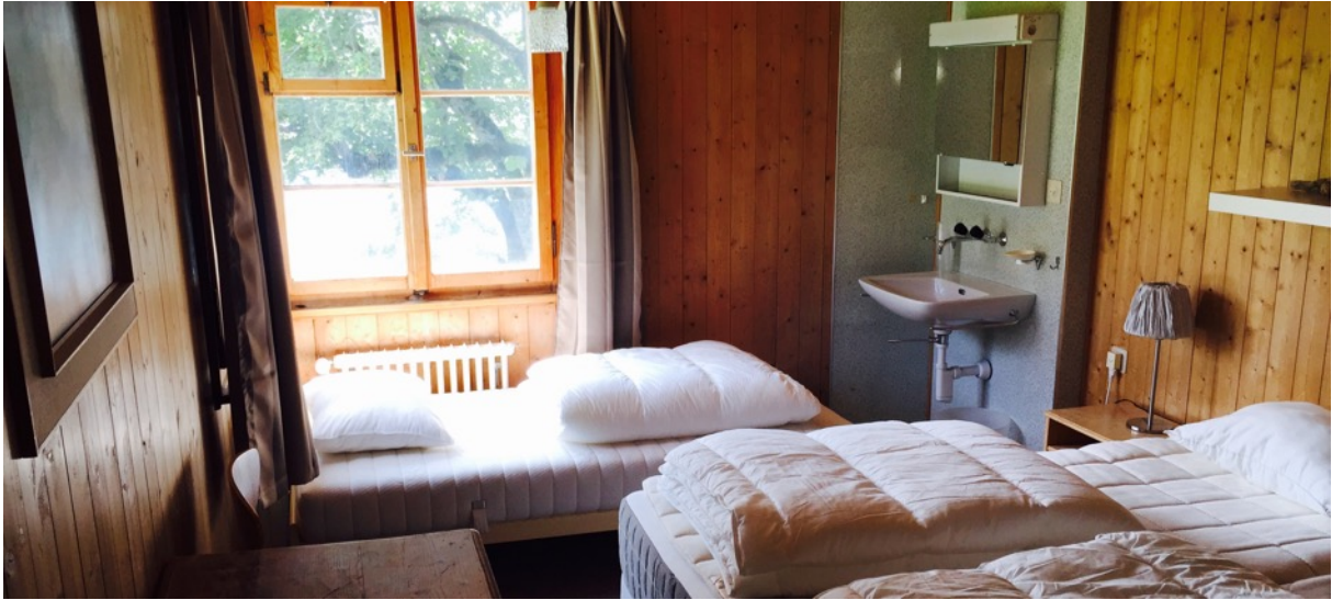
Ferienwohnung als Leiterwohnung oder weitre Hotelzimmer